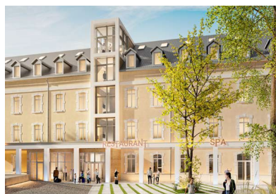
2. Garrigae Caserne à Briançon (05)

2. Promotion - Projet de réhabilitation d'une ancienne caserne militaire en hôtel de 83 chambres.