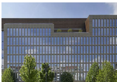
1. Pulse à Saint-Denis (93)

1. Foncière - Immeuble de bureaux de 28 860 m 2 en structure mixte bois-béton qui accueillera à partir de 2026 les équipes du conseil départemental de Seine-Saint-Denis.