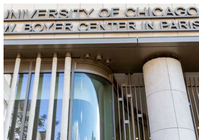
4. Université de Chicago à Paris (75)

4. Promotion - Construit au-dessus d'une gare, le nouveau centre parisien de l'Université de Chicago s'étend sur 2 400 m 2 de surface de plancher et présente une structure bois majoritaire.