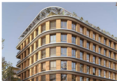
3. Viaterria à Lyon (69)

3. Promotion - Immeuble de bureaux avec façade en terre crue conçue par Terrio, start-up incubée par Icade via son start up studio Urban Odyssey.