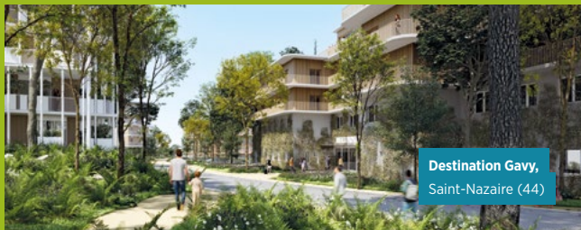
Destination Gavy, Saint-Nazaire (44)

© OBRAS, © D'ICILLA et Patriarache, © Mars et Vendredi