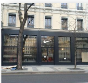
Nike Store, Lyon

Ces faits marquants illustrent la stratégie de repositionnement d'ANF Immobilier pour ses commerces, rue de la République à Marseille, avec un double objectif : acter une différenciation et renouveler son attractivité commerciale.