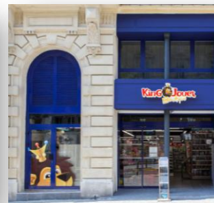
King Jouet, Marseille

À Lyon, après avoir remporté, à l'été 2013, l'appel d'offres pour l'acquisition de la Banque de France, rue de la République, ANF Immobilier a réussi son pari de reconversion du bâtiment historique en à peine 3 ans : Nike a ouvert en mars sur 500 m 2 et Maxibazar en septembre sur 2 000 m 2 . Le succès est d'ores et déjà au rendez-vous pour les deux enseignes.