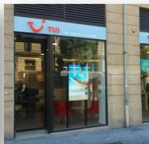
TUI Store, Marseille