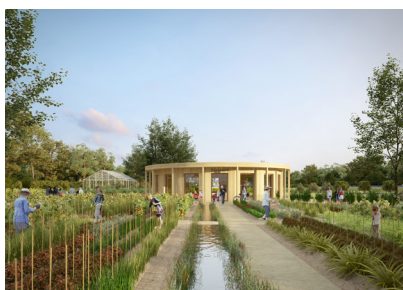
Le Jardin Nourricier - L'Ecocentre