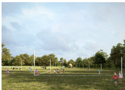
La Prairie des Sports