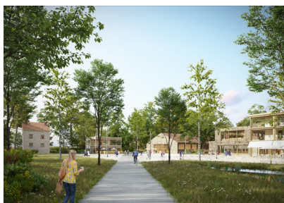
La Place Boisée : une place active. Une entrée de quartier animée regroupant commerces, écoles et activités emblématiques (recyclerie, maison du bois, maison de l'économie collaborative et participative). © Lotoarchilab

Dans une démarche alliant innovation éducation et ambition environnementale sont aussi prévus des commerces et activités (alimentaire bio, restaurant et atelier de transformation, micro-ferme, pépinières...), des lieux d'apprentissage traditionnels