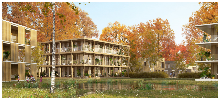
Les Bosquets Habités : Le cœur d'îlot des pièces de verdure : un cadre de vie offrant une nature foisonnante