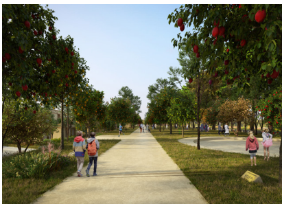
La Grande Terrasse

Deyrolle a écrit la philosophie du projet. Elle réside en la création d'un écosystème, notamment nourricier, répondant aux enjeux majeurs environnementaux et sociétaux contemporains, et a pour socle le triptyque deyrollien Nature-Art-Education.