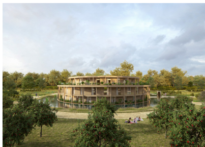
L'Arche : un hôtel, géré par le Groupe ACCOR, tourné vers le bien-être et l'épanouissement personnel (séjours courte durée autour du yoga, de la méditation et du jeûne).