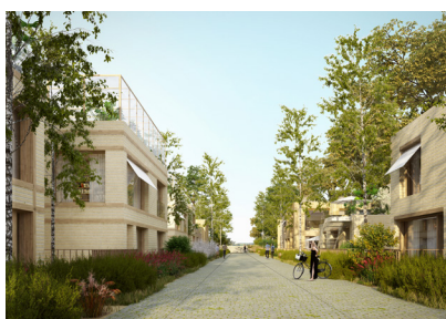
Les Venelles : un alignement de maisons sur des venelles apaisées au cœur de la cité-jardin.

(crèche et école avec pédagogie alternative) et novateurs (écocentre, conciergerie dédiée à la transition énergétique, maison du bois, espace de recyclage...) ainsi qu'un hôtel, un centre équestre et une plaine dédiée au sport.