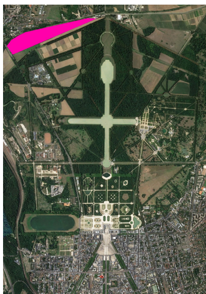
Implantation du quartier entre le domaine du Château et Saint-Cyr-l'École.