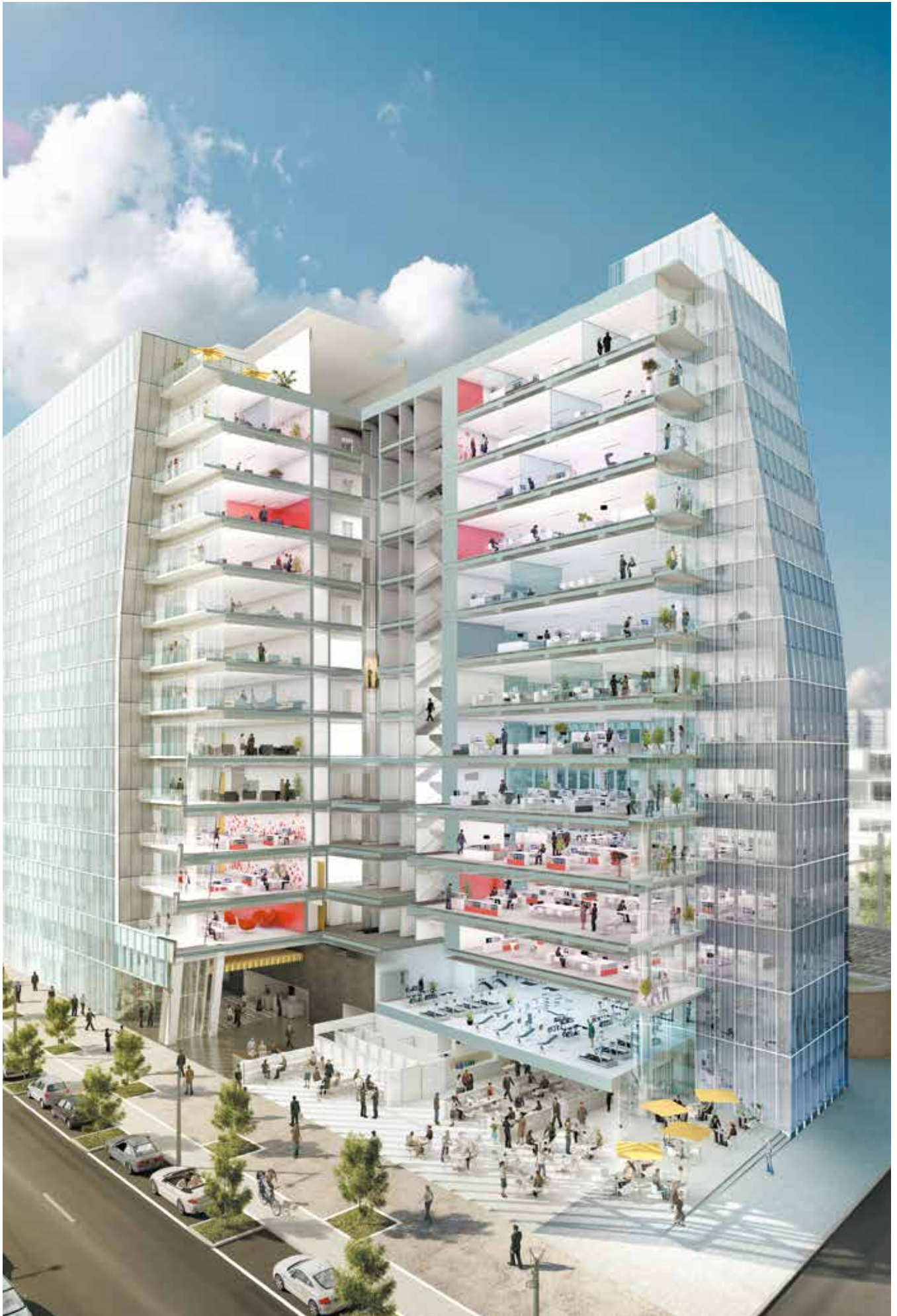
SKY 56, une nouvelle expérience de vie au travail ▲