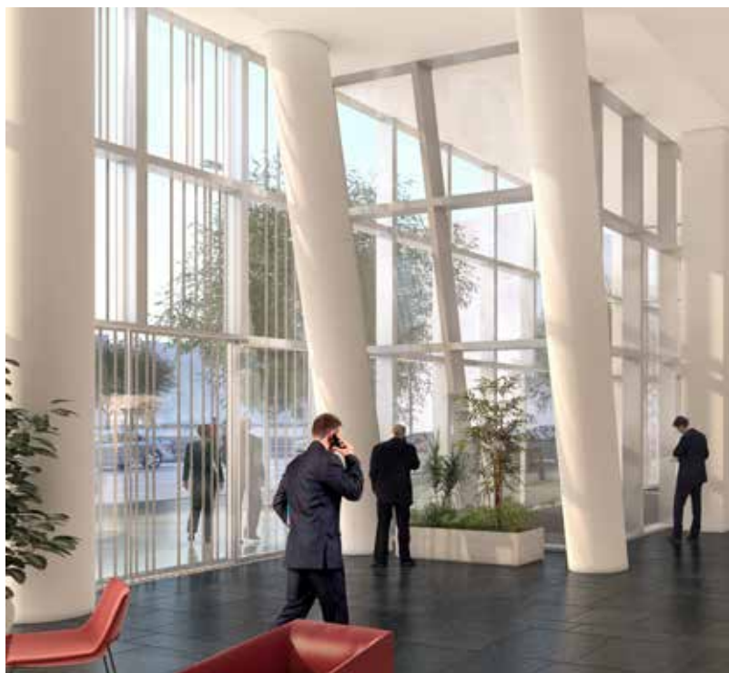
La vie en "mode confort" ^^ Hall d'entrée de l'immeuble SKY 56 ^ Le sky bar situé au 14 e étage ^^